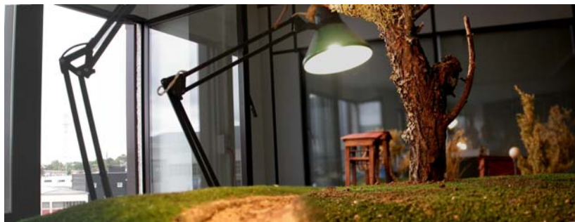
Una de las maquetas utilizadas para la producción, siendo iluminada para captar una luz especial.

En la película se pueden ver escenarios reales de Donosti, Pasajes o Irun, que una vez representados en maqueta e iluminados según el momento del día que se desea reproducir, se fotografía el pequeño escenario y esa misma foto la utilizan los animadores como base para la animación.