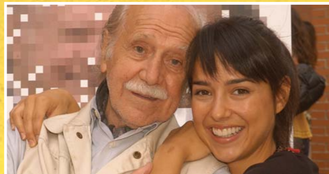
Cristina Brondo (Ana)

Filmography: Elsa y Fred (2005), Incautos (Swindled) (2003), Lázaro de Tormes (2000), Todos a la cárcel (Everyone Off to Jail) (1993), Amanece que no es poco (1988), El año de las luces (The Year of Enlightenment) (1986), Atraco a las tres (1962), Plácido (1961), ¡Bienvenido Mr. Marshall! (Welcome, Mr. Marshall!) (1952) - nearly 180 films in all. Alexandre has received various awards, including an honorary Goya in 2003.