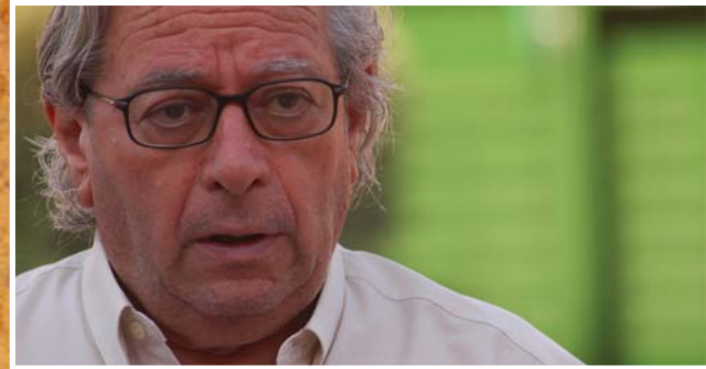
Antonio Mercero (Director / Guionista - Director / Screenplay writer)

Su vida profesional se ha desarrollado básicamente en el ámbito de la televisión, destacando sobre todo por series míticas como "Crónicas de un pueblo", "Farmacia de guardia" o "Verano azul". Su éxito en la gran pantalla le llega con "Planta cuarta" (2002). Entre su extensa filmografía cinematográfica se encuentran "Don Juan mi querido fantasma" (1990), "La guerra de papa" (1977) y "La cabina" (1972).